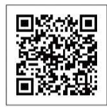
看護部特設サイト